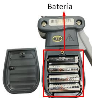
Imagen 3 - Recargo baterías.

Cuenta con 4 pilas AA de 1,5v alcalinas.