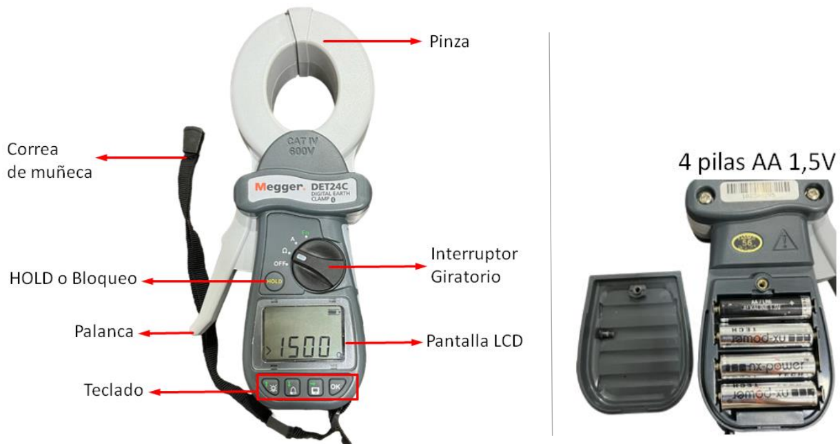
Imagen 1 -Display de la Pinza Comprobadora de Resistencia de Tierra DET24C - Megger.

Controles del Comprobador de Resistencia de Tierra DET24C.