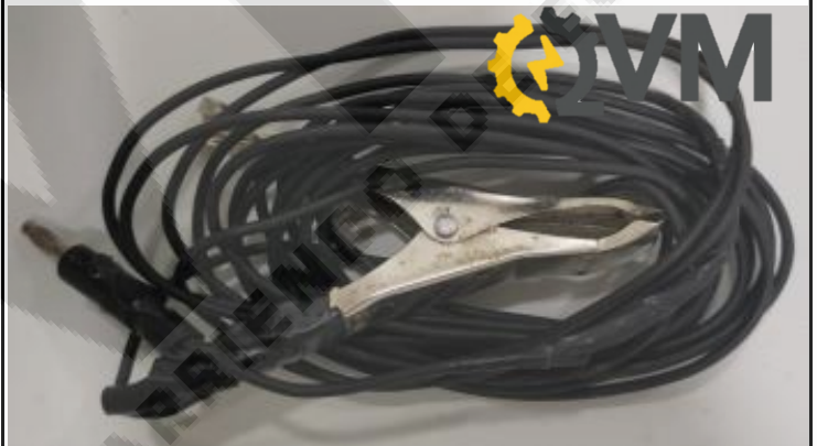
Cable negro de repuesto