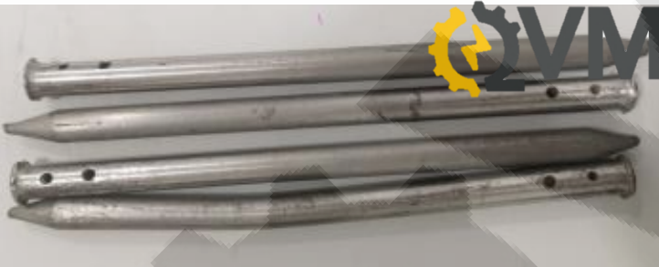
4 estacas de acero inoxidable