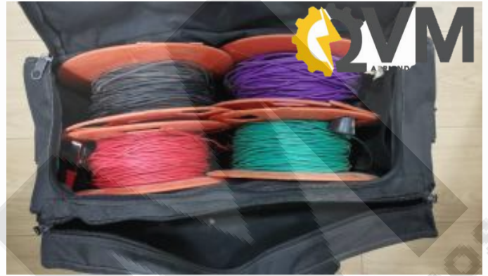
Carretes con cables negro, verde, rojo y morado