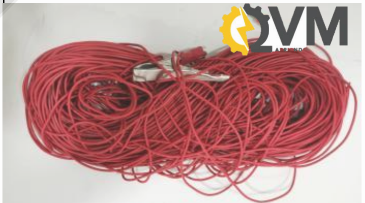
Cable rojo de repuesto