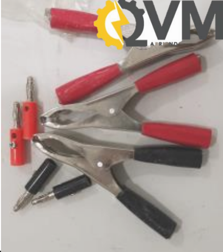
Pinzas y conectores de repuesto