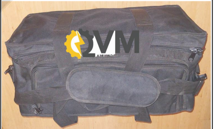
Bolso de transporte