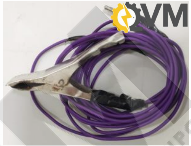
Cable morado de repuesto