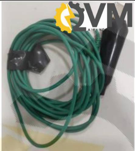
Cable verde de repuesto