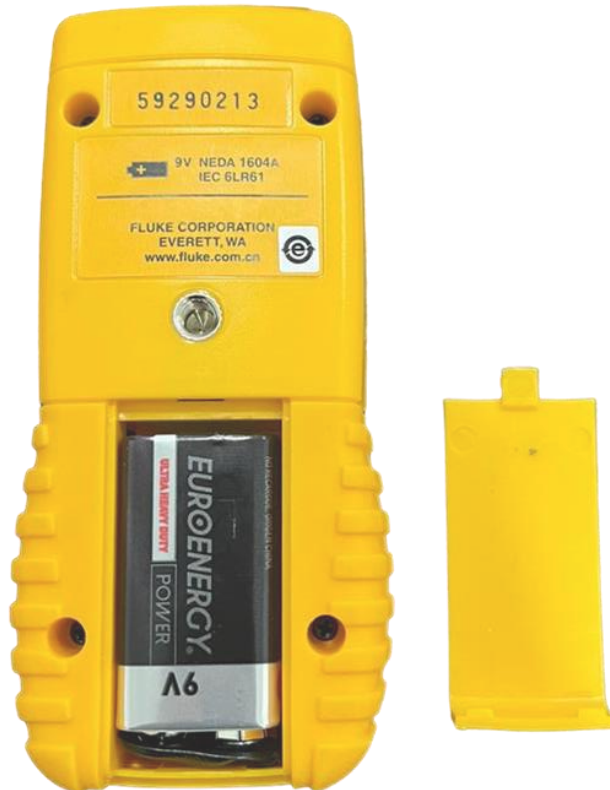
Imagen 2 - Recargo baterías.