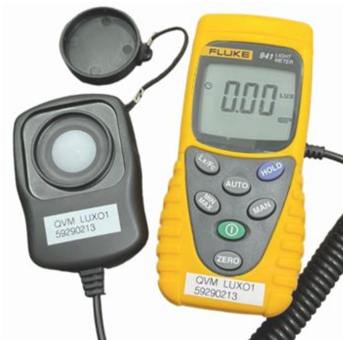
Imagen 1 - Luxómetro 941 Fluke.

Basta con encender el luxómetro, colocarlo en unidad "Lux", quitar la tapa del sensor y comenzar a medir.