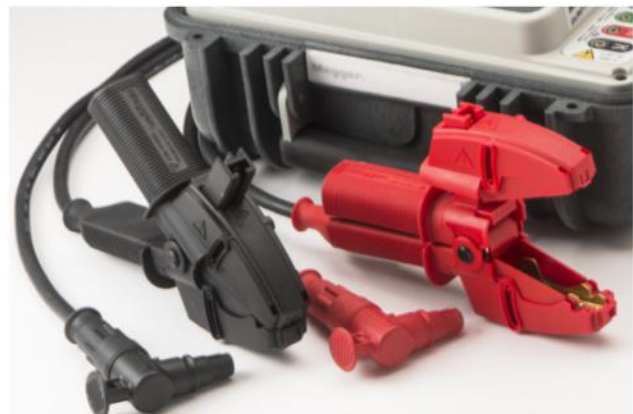
Una nueva abrazadera ajustable dura ha sido diseñada para garantizar la flexibilidad en muchas aplicaciones y proporciona una buena conexión con la pieza de prueba.

En el modo continuo , el usuario conecta los cables de prueba y pulsa el botón TEST, iniciando de este modo el procedimiento de prueba. El instrumento continuará realizando la prueba, actualizando la información de la pantalla después de cada ciclo de prueba nuevo, hasta que se pulse el botón TEST o finalice el procedimiento de prueba.