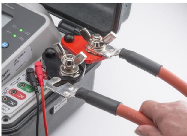
Se ha designado un adaptador de terminales nuevo para que los clientes puedan utilizar sus propios cables de prueba.

Selección rápida y sencilla de los interruptores giratorios de las pruebas de 10, 50 y 100 A; no requiere configuración