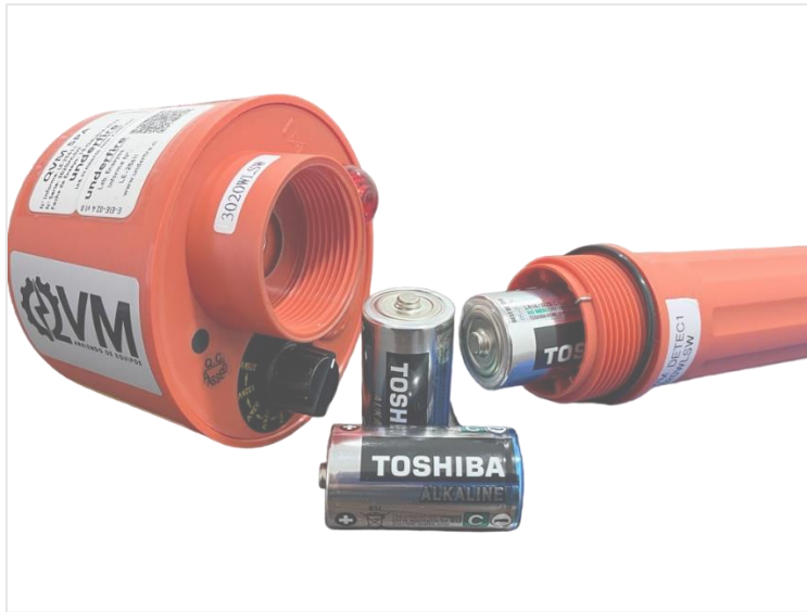
Imagen 3 - Recarga baterías.

El equipo utiliza 3 pilas 1,5V tipo "C".