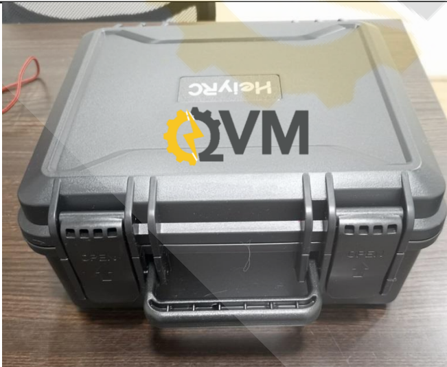
Malerín de transporte