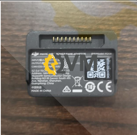
daptador de banco de carga para usb,