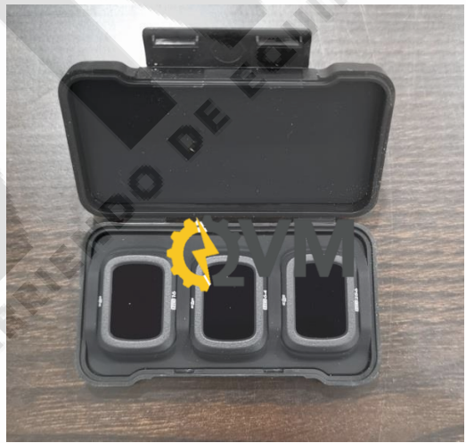
Filtros de lente