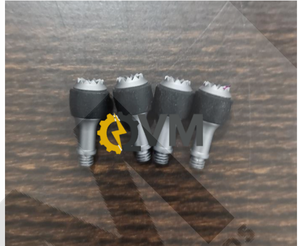
Palanquitas para el control