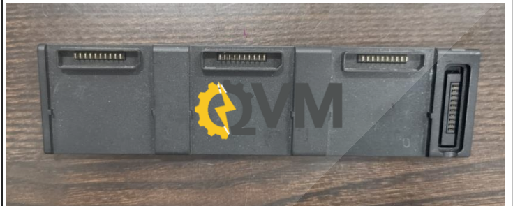
Banco de carga