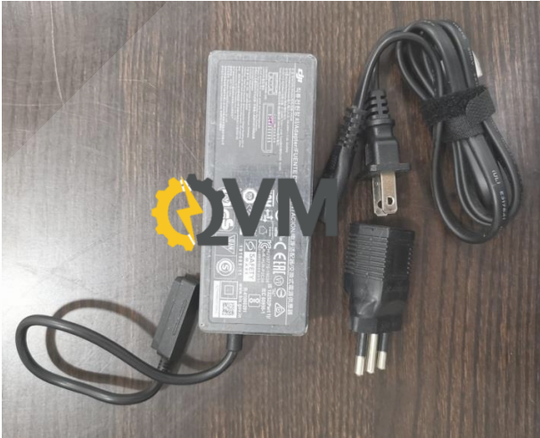
Trasformador y enchufe